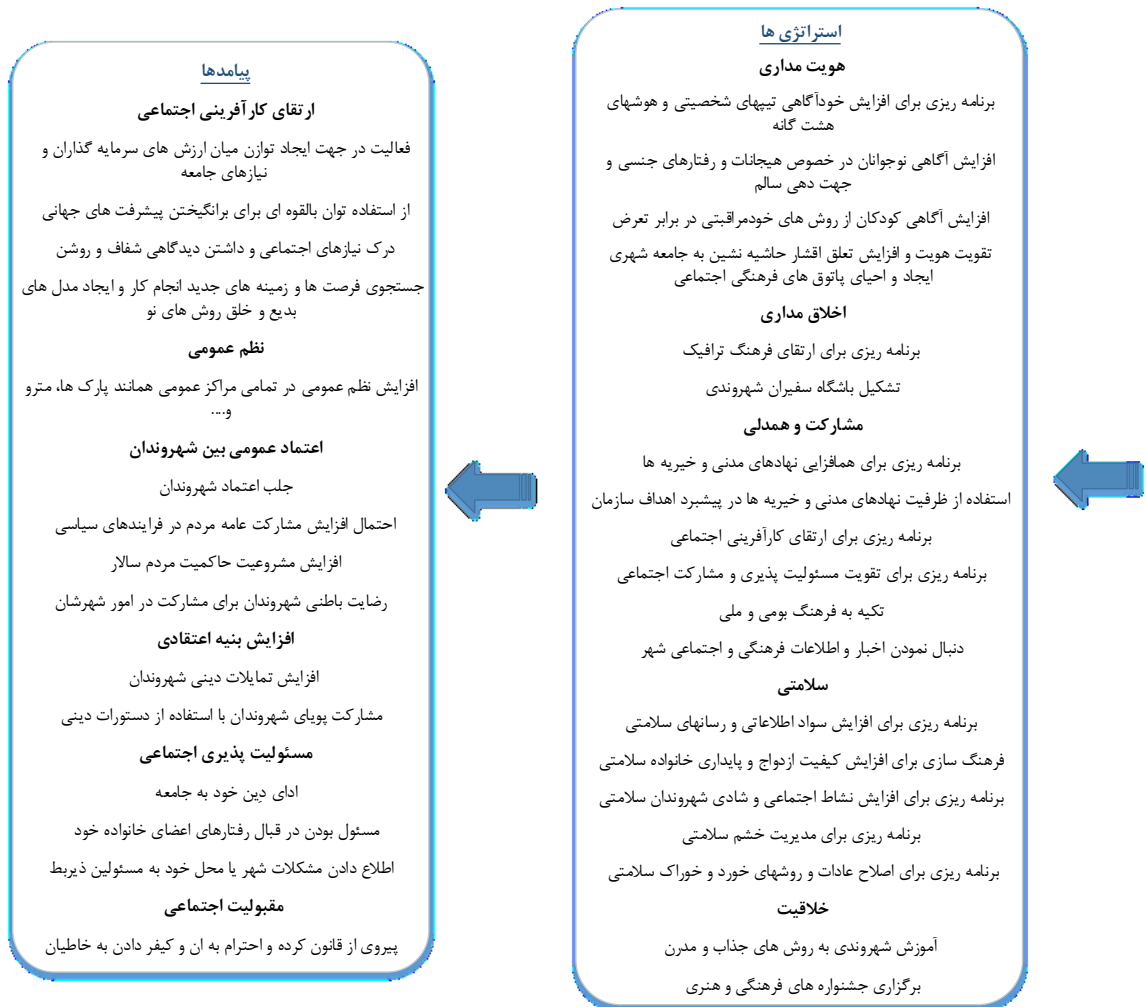
شکل ۲: الگوی شهروند فرهنگی

این دسته‌بندی و توافقاتی که در ادامه هر کدام از این دسته‌بندی‌ها به صورت مجزا آورده شده است.